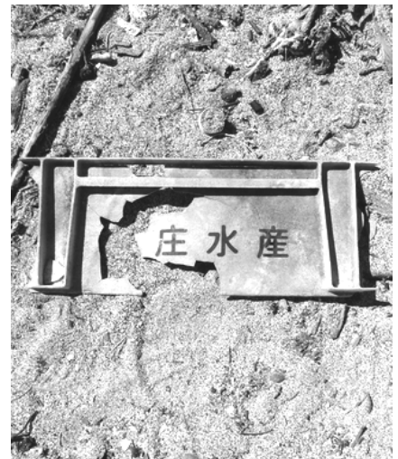
カミロビーチ (ハワイ島) の漂着物